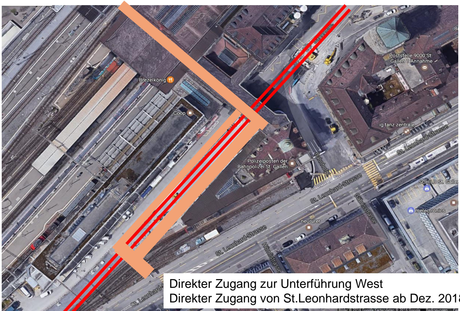
Direkter Zugang zur Unterführung West Direkter Zugang von St. Leonhardstrasse ab Dez. 2018